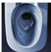
アクアセラミック