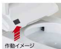
お掃除リフトアップ