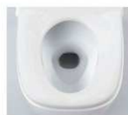
ワイドスクエア便座

※プラズマクラスターロゴ及びプラズマクラスター、Plasmaclusterは、シャープ株式会社の商標です。