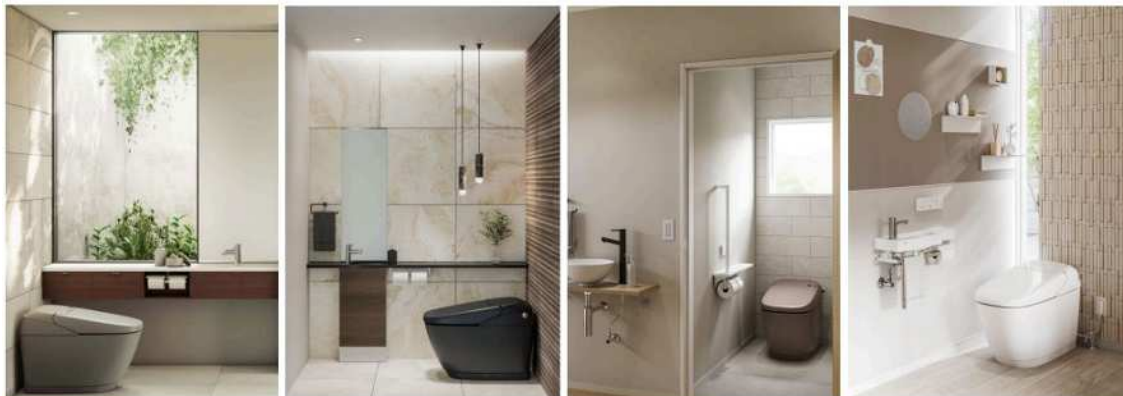
左からノーブルグレー、ノーブルブラック、ノーブルトープ、ピュアホワイト

空間に美しく馴染む大好評のノーブルレーベル3色とピュアホワイト色をラインアップしています。