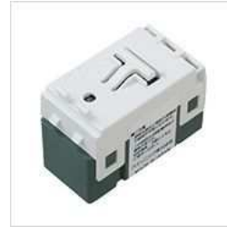
[子器]4路配線対応形 埋込[電子]スイッチ（ほたる機能付）