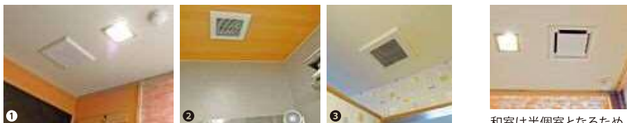
①小上がりの和室(約21㎡・天井高約2.1m)にはCO 2 センサー搭載換気扇を2台設置 ②製麺室にも1台設置③2階の高須会様事務所でも休憩室などに2台導入

大平様とは共にゴルフの大会を観に行くほど親しい間柄。ご相談に応じて細やかに機種特性などもご説明いただいた