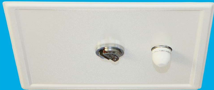
天井埋め込み型なら景観を保護