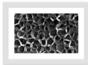
押出法ポリスチレンフォーム