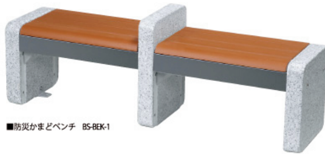
■防災かまどベンチ BS-BEK-1

災害発生後の吹き出しなどで活躍が期待されるかまどベンチ。通常時は座板の中に、五徳・風受けパネル・灰落しパネル簡易脚部を収納しており、いざというときには本格的なかまどに変身し、座板部は簡易スツールとして利用できます。