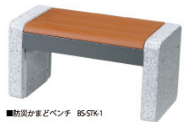
■防災かまどベンチ BS-STK-1

災害発生後の吹き出しなどで活躍が期待されるかまどベンチ。通常時は座板の中に、五徳・風受けパネル・灰落しパネル簡易脚部を収納しており、いざというときには本格的なかまどに変身し、座板部は簡易スツールとして利用できます。